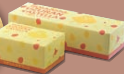
Quail egg Castella