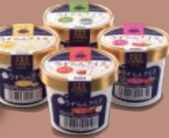
Quail egg Ice cream